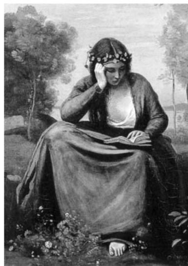
Cititoarea (pictură de Jean-Baptiste-Camille Corot)

Cunoașterea transmisă și reprodusă în școală spune multe nu numai despre învățământ, ci și despre societatea în care acesta funcționează. Seria întrebărilor ce pot fi formulate pe această temă