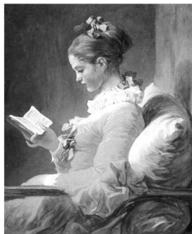
Tânăra citind (pictură de Jean-Honoré Fragonard)