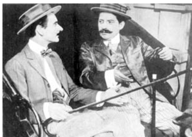
Scenă dintr-o schiță a lui I.L. Caragiale

F.: E încuiată odaia. D.: Bate-i, să deschidă. F.: Apoi, a luat cheia la dumnealui când a plecat. D.: Care va să zică, a plecat? F.: Nu, domnule, n-a plecat. D.: Amice, ești... idiot. F.: Ba nu, domnule. D.: Zici că nu-i acasă? F.: Ba-i acasă, domnule. D.: Apoi, nu ziseși c-a plecat? F.: Nu, domnule, n-a plecat. D.: Atunci e acasă. F.: Ba nu, dar n-a plecat la țară, a ieșit așa. D.: Unde? F.: În oraș! D.: Unde!? F.: În București. D.: Atunci să-i spui c-am venit eu. F.: Cum vă cheamă pe dv.? D.: Ce-ți pasă? F.: Ca să-i spui. D.: Ce să-i spui? de unde știi ce să-i spui, dacă nu ți-am spus ce să-i spui? Stai, întâi să-ți spui; nu te repezi... Să-i spui când s-o-ntoarce că l-a căutat... F.: Cine? D.: Eu. F.: Numele dv.?... D.: Destul atâta! mă cunoaște dumnealui... suntem prieteni... F.: Bine, domnule.