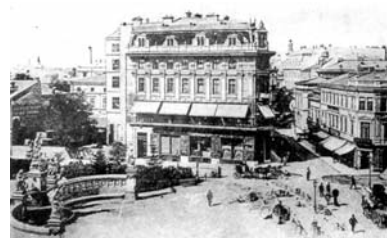
Piața Sărindar (sfârșitul sec. al XIX-lea)