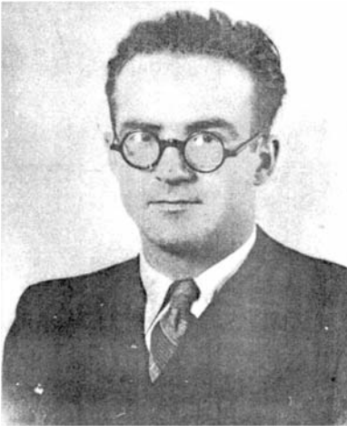
Mircea Eliade (1907-1986), prozator, eseist, filozof, istoric al religiilor.

Corigența face parte din volumul Romanul adolescentului miop de Mircea Eliade, carte definitivată înainte ca autorul să împlinească 19 ani, dar publicată postum, abia în 1989.