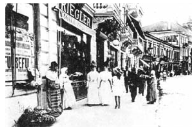
Cafeneaua Riegler de pe Calea Victoriei (1908)