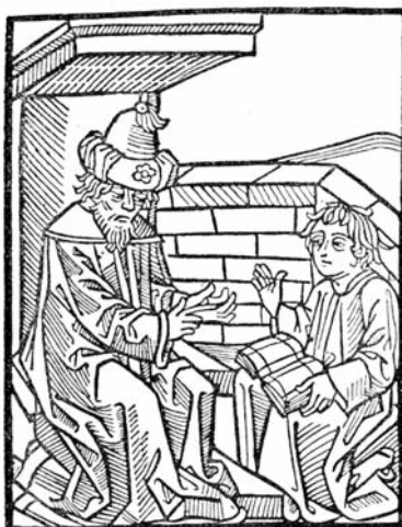
Profesor și discipol (gravură din anul 1475)