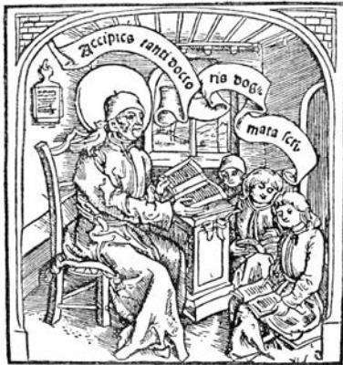
Papa Grigore cel Mare în ipostază de învățător (gravură din sec. al XVI-lea)