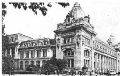
Palatul Poștei (1899)

Înțelegi bine că un an de întârziere, pentru inaptitudine la muzică sau la gimnastică!... Dar asta, trebuie să convii și dumneata, e tot așa de absurd ca și când ai împiedica pe un tânăr dispus să învețe Dreptul să piarză un an, fiindcă nu e tare la Morală... Ce are a face Morala cu cariera de avocat, pe care vrea tânărul să o îmbrățișeze?... Ba nu, spune d-ta!