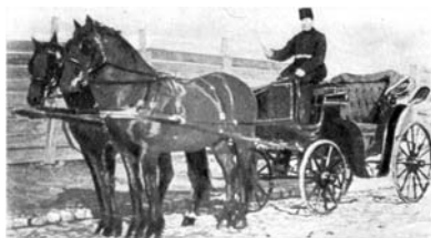
Birjar în trăsură (sec. al XIX-lea)

Schiță – specie a genului epic de dimensiuni reduse, cu acțiune limitată la un singur episod caracteristic din viața unuia sau a câtorva personaje.