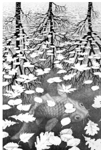
Desen de M.C. Escher