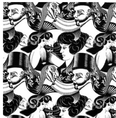
Desen de M.C. Escher