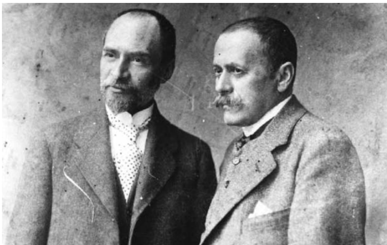
I.L. Caragiale și George Coșbuc