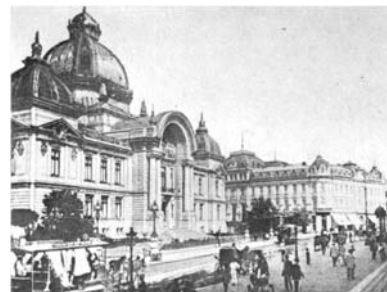
Casa de Depuneri și Grand Hotel

După ce ai completat coloana din dreapta și ai aflat deznodământul, verifică-ți predicția.