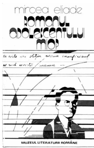
Coperta ediției princeps

Corigența face parte din volumul Romanul adolescentului miop de Mircea Eliade, carte definitivată înainte ca autorul să împlinească 19 ani, dar publicată postum, abia în 1989.